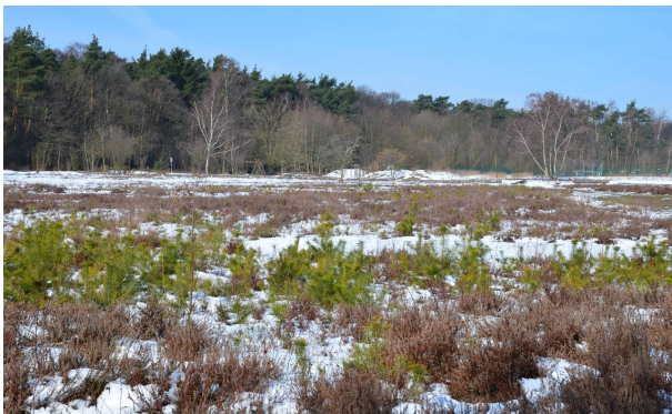
Im Winter fallen die jungen Kiefern zwischen dem Heidekraut besonders auf

Mittlerweile haben sich auf der trockenen und besonnten Heidefläche einige Pflanzen- und Tierarten eingefunden, die noch vor wenigen Jahren selten waren oder gar nicht beobachtet werden konnten. Es geht heute darum, das Erreichte zu erhalten.