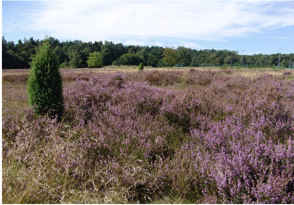
Blühende Heide im August

Die Stierstädter Heide im Westen Oberursels am Rand des Oberurseler Stadtwaldes ist die größte noch erhaltene Heidefläche im Vortaunus.