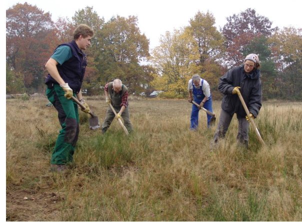
Heidepflege ist Handarbeit

Dabei braucht die zahlenmäßig kleine Gruppe der Aktiven in der SDW Oberursel Unterstützung bei dieser zeitaufwändigen Arbeit.